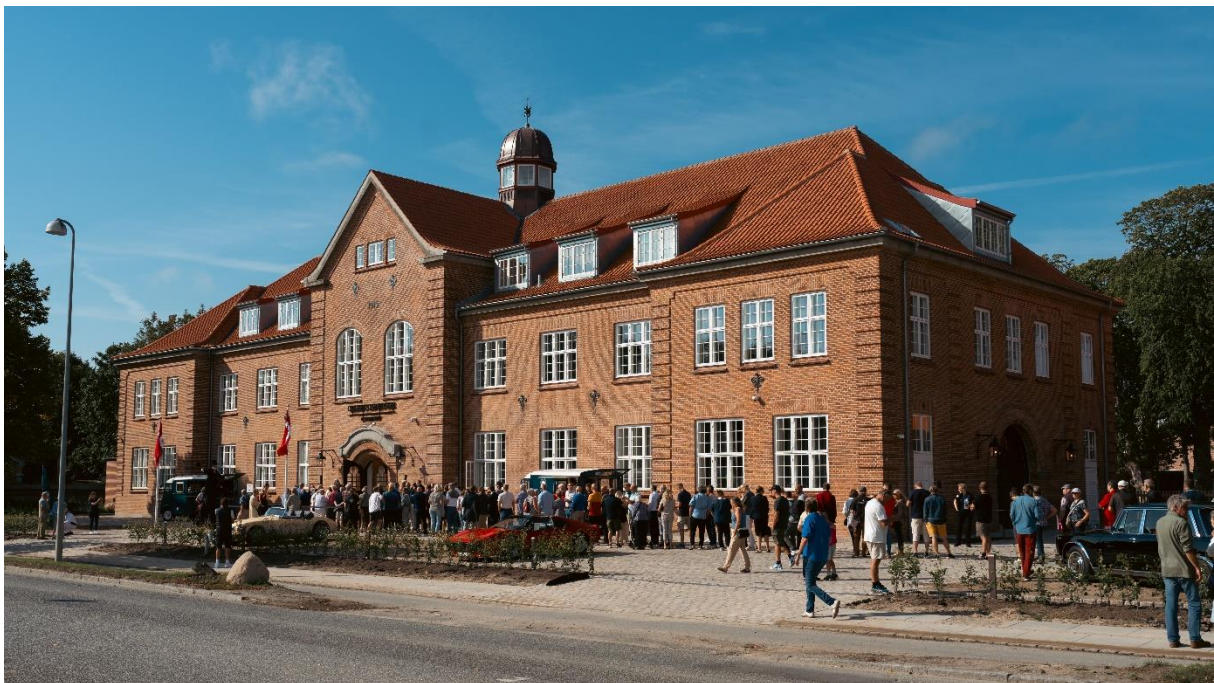
Classic Car House i Kongens Lyngby