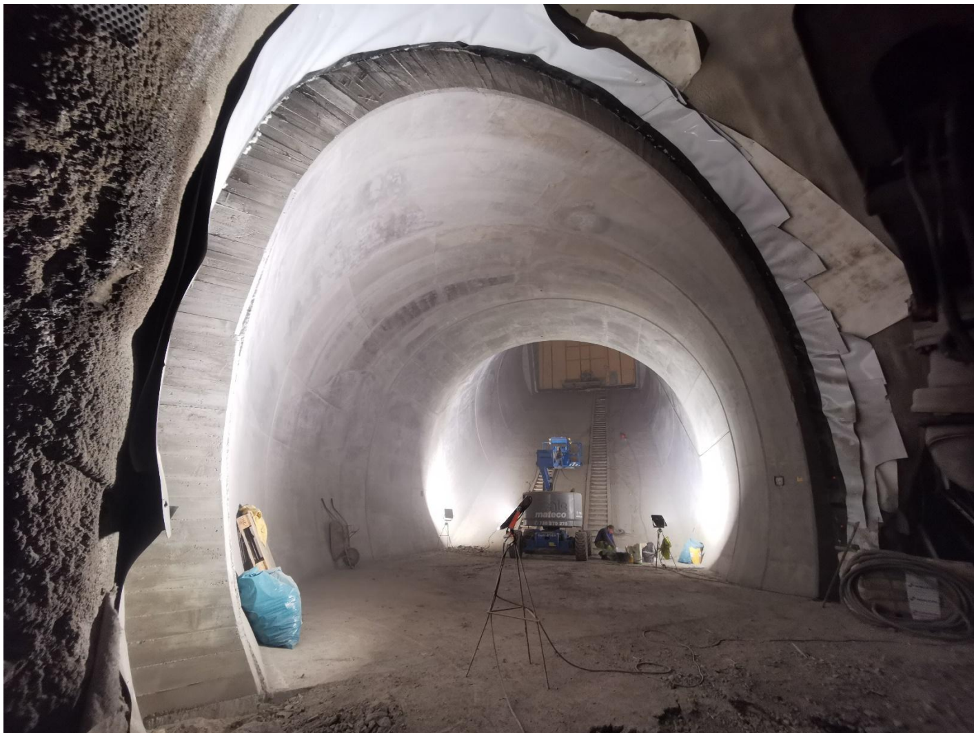
„Obr. 7 – Kompletně dokončené sekundární ostění“