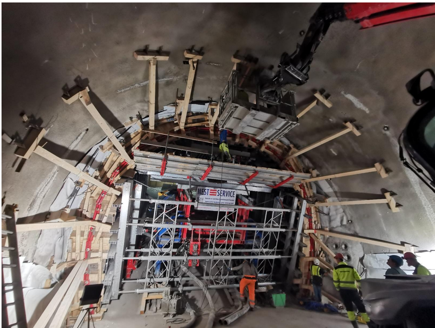
„Obr. 6 – Bednění prvního bloku horní klenby eskalátorového tunelu“

pro zatáčku. Po dokončení betonáže bloků v oblouku bylo definitivní ostění objektu přestupní chodby a eskalátorového tunelu kompletně dokončeno (obr. 7).