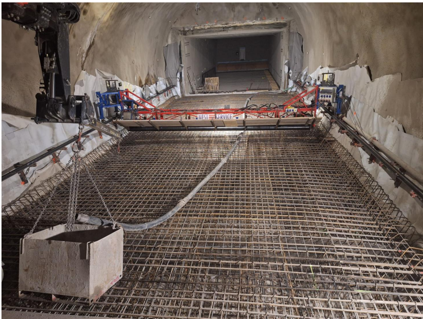
„Obr. 5 – Finišer pro betonáž spodní klenby“