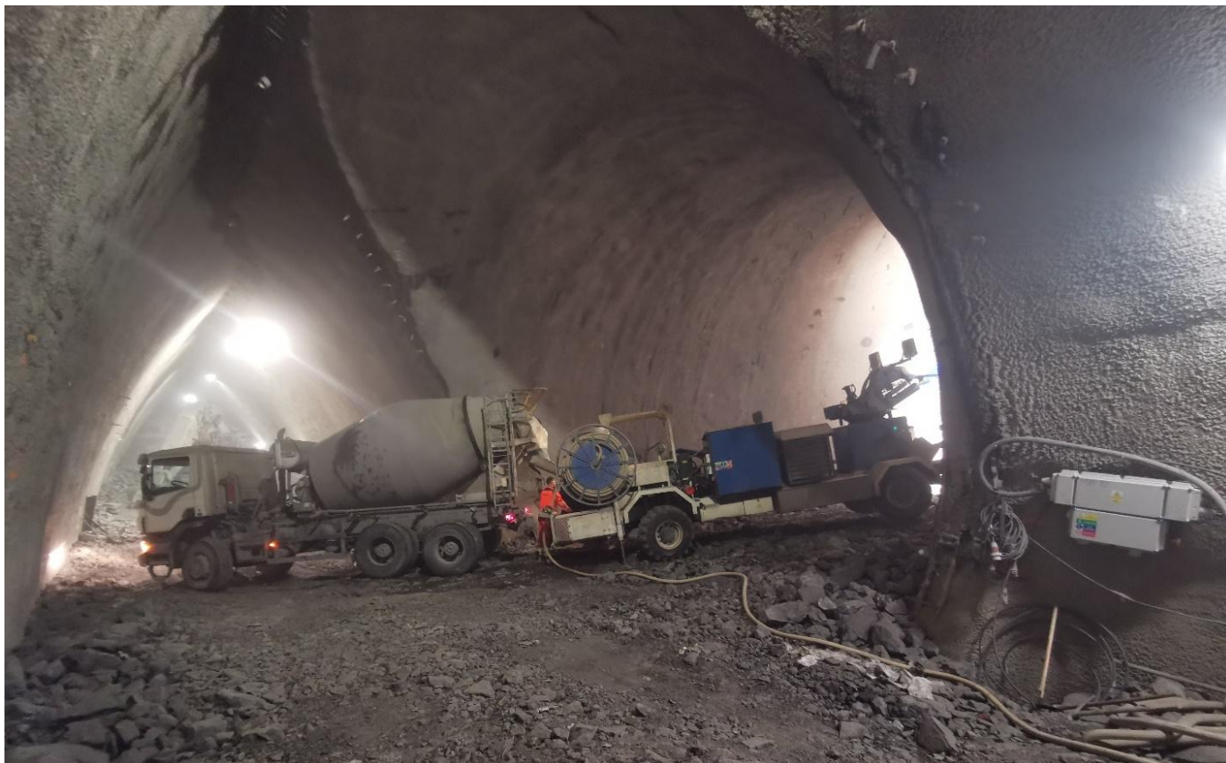
„Obr. 2 – Zahájení ražby kaloty přestupní chodby“

v každém druhém záběru, které byly rovněž tlakově injektovány s parametry injektáže 15 kg/m vrtno nebo dosažení tlaku 60 bar. Ražba byla zahájena 15.3.2025 a v obou výrubech dokončena k 5.4.2025 (obr. 2). Následovaly přípravy pro zahájení ražby šikmé části eskalátorového tunelu, která je dlouhá 22,27 m a má plochu výrubu 105,13 m 2 . Eskalátorový tunel je ražen dovrchně ve sklonu 30°. Zhotovitel využil možnost ražby zhruba 10 m kaloty šikmé části strojní sestavou využitou při ražbě přestupní chodby. Následně byla vybetonována provizorní železobetonová rozpěrná deska dna kaloty. Tloušťka desky byla 400 mm a byla vyztužena dvěma vrstvami svařovaných sítí 8x8/150x150 s příčnými příložkami Ø 16 mm s další přídatnou smykovou výztuží v oblasti ukotvení dvou ozubených kolejnic pro posun plošiny pro šikmou ražbu eskalátorového tunelu.