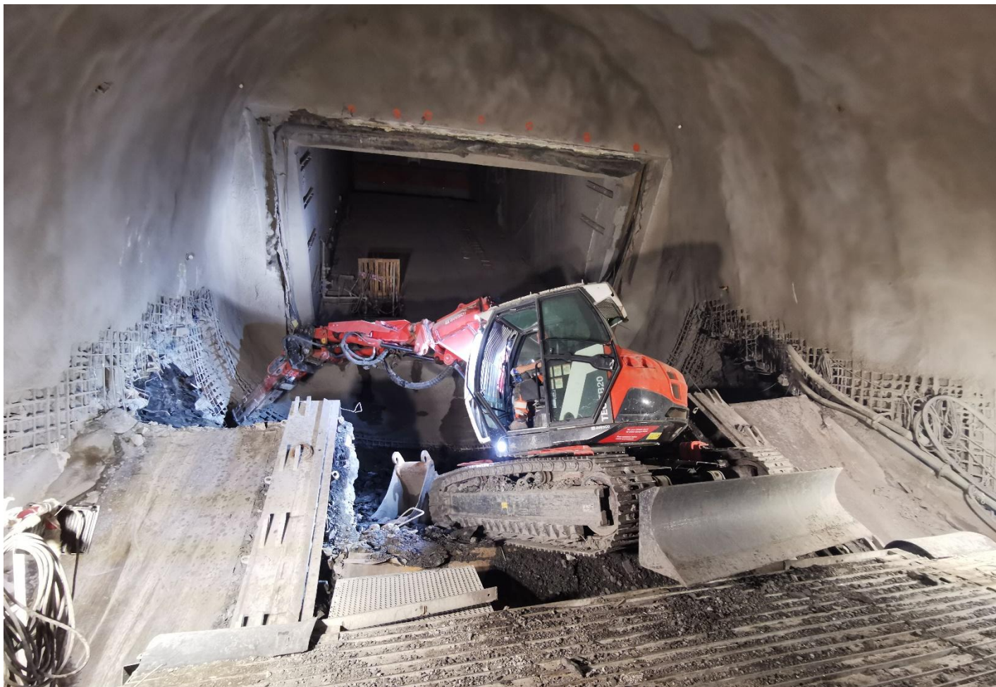
„Obr. 4b – Ražba spodní kelnby eskalátorového tunelu“